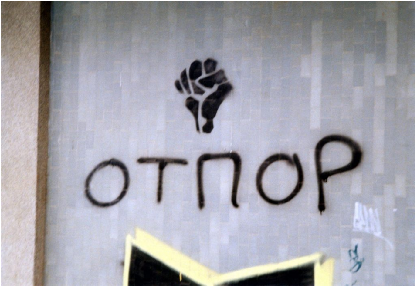
Ilustracija 2: Simbol Otpora, pesnica, kod fakultetske zgrade u Novom Sadu u Srbiji, 2001

značajano su doprinijele da se pokrenu birači tokom izbora 2000ite godine (izbor učesnika u 2000itoj godini iznosio je 71% u odnosu na 48% u 1997 godini). S obzirom da Milošević poraz na izborima nije htio da prihvati, dolazi u cijeloj zemlji do masovnih demonstracija, što je na kraju krajeva značilo završetak Miloševićevog autoritarnog vladanja.□