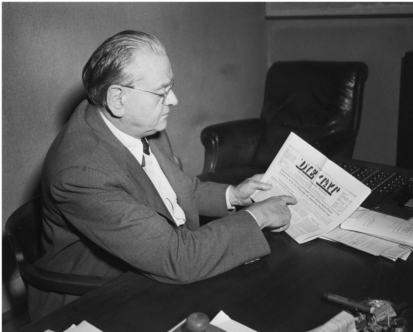
GOTTLIEB DUTTWEILER, DER GRÜNDER DER ZEITUNG DIE TAT , 7. JULI 1950

Dem entspricht auf publizistischer Seite die alternative Presse, die in dieser Phase an Bedeutung gewinnt, von der die meisten Titel aber wieder eingehen. Der in der Überschrift des Beitrags geäußerte Zusammenhang zwischen Lesen und politischer Präferenz ist damit in Teilen durchaus noch gegeben, er wird indes unweigerlich schwächer. Dies gilt insbesondere für die etablierte Publizistik, die unter dem Druck der Investitionen in technologische Neuerungen – Stichwort elektronische Redaktionssysteme und Digitalisierung des Drucks –, wegfallender Partei- und ergo Leserbindungen sowie der wachsenden Inseratenabhängigkeit sich in immer härter umkämpften Märkten befindet.