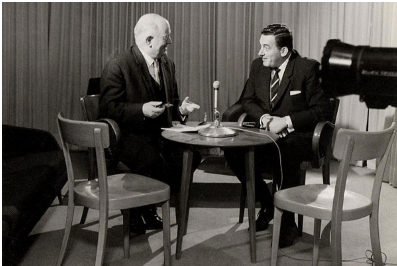
FERNSEHSTUDIO VOR 1965

In den 1960er Jahren sehen die Verhältnisse in der helvetischen Medienlandschaft und ihrem Publikum noch anders aus. Die politische Berichterstattung ist zu grossen Teilen immer noch in der Hand von Blättern mit grosser Nähe zu den politischen Parteien und die persönliche politische Gesinnung ist vielerorts weniger Ausdruck argumentativer Auseinandersetzung mit offenem Ausgang als eine eingespielte Konstante, die sich aus Tradition und gesellschaftlichem Umfeld ergibt.