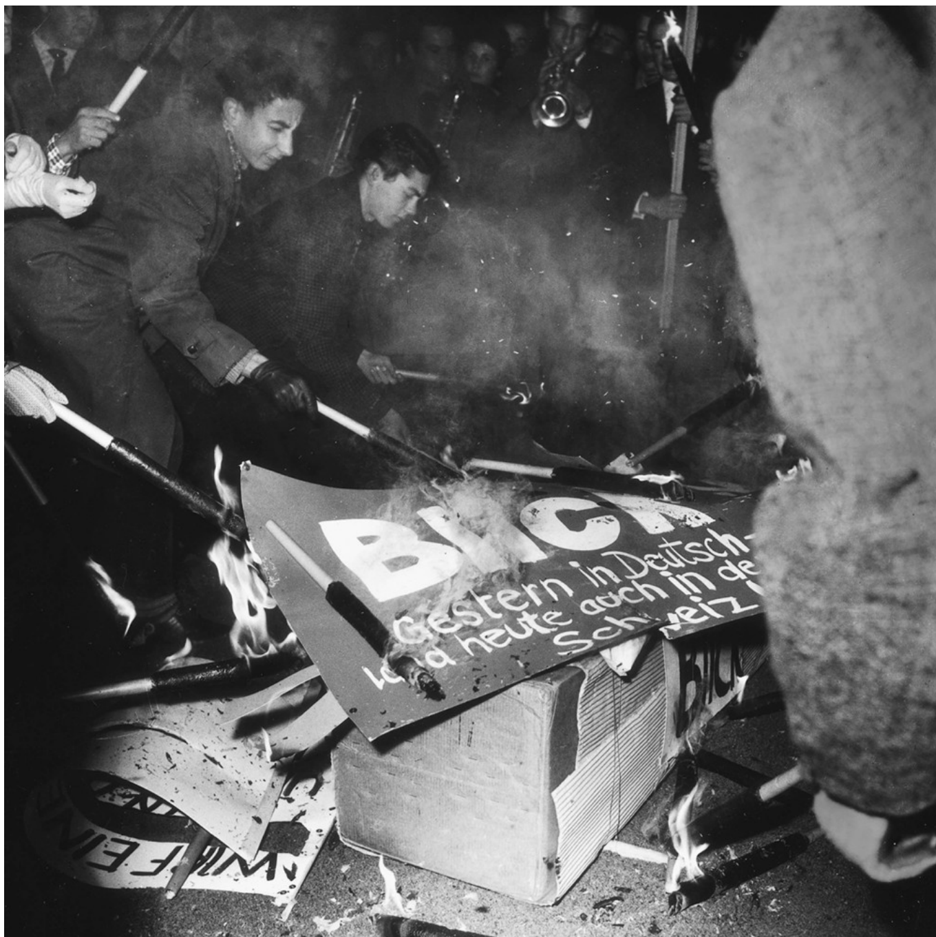
STUDETISCHER PROTEST GEGEN NEUE BOULEVARDZEITUNG "BLICK", BERN 1959