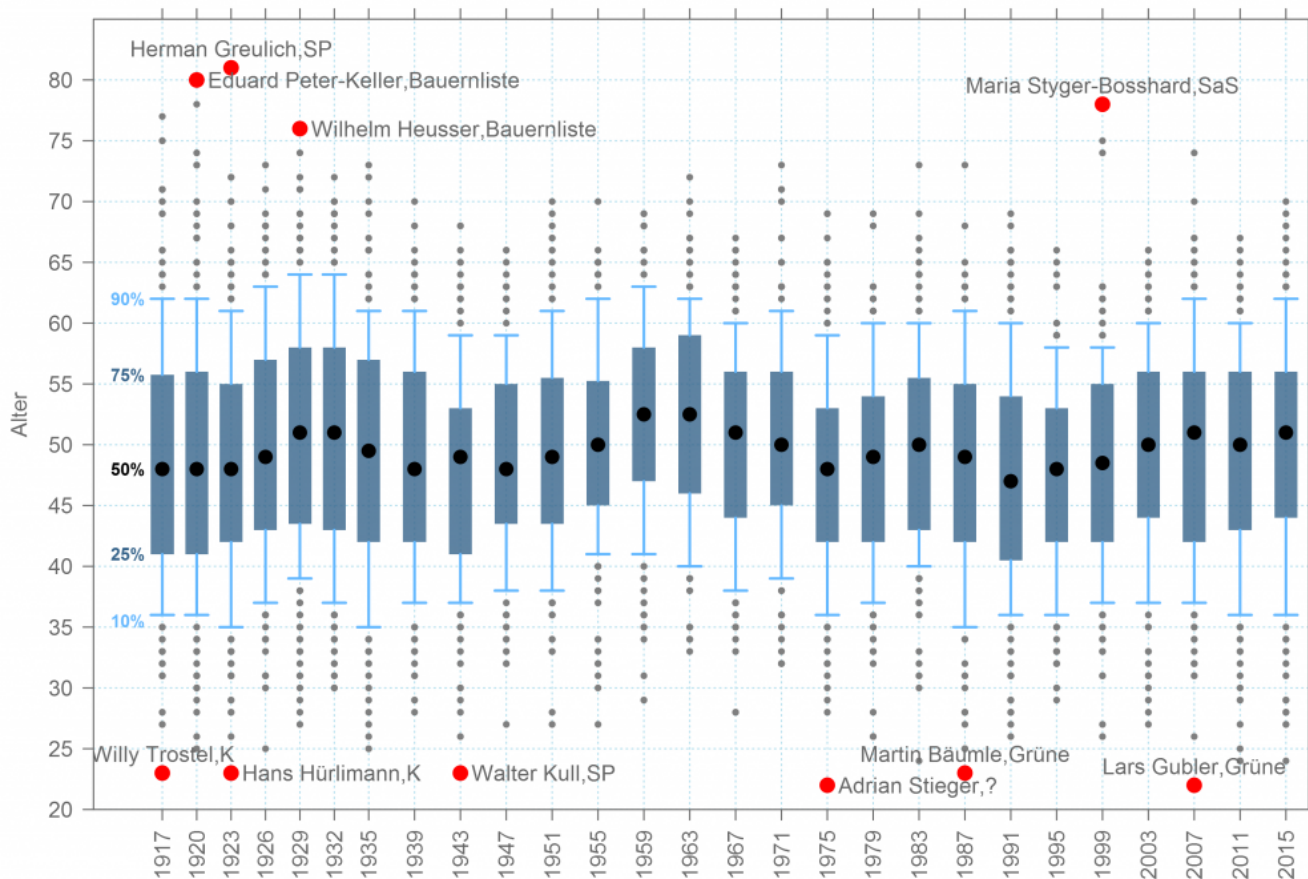
ABBILDUNG 2: ALTERSVERTEILUNG IM ZÜRCHER KANTONS RAT AM LEGISLATURBEGINN 1917-2015

Die Ratsmitglieder rekrutieren sich zudem aus einem engen Alterssegment und auch diesbezüglich sind keine langfristigen Trends auszumachen: 1917 wie 2015 waren 80% der Kantonsräte zwischen 36 und 62 Jahre alt. Sehr junge Kantonsräte, wie etwa Martin Bäumle, der den Sprung in den Rat, damals noch für die Grünen 1987 mit 23 schaffte, waren stets die grosse Ausnahme.