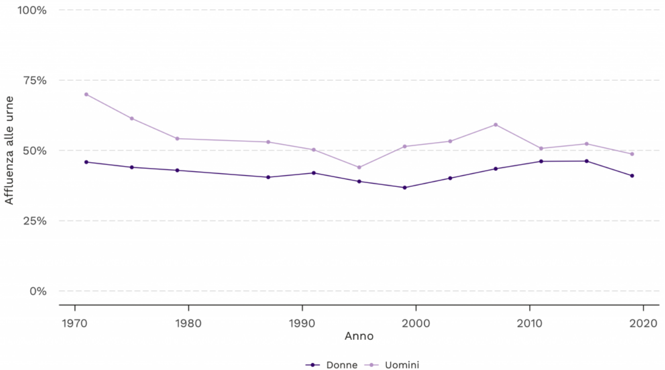
Illustrazione 1: differenze dell'affluenza alle urne tra donne e uomini

Ma già in occasione delle votazioni successive il divario tra i due generi si era ridotto, e da allora è progressivamente diminuito fino a raggiungere il minimo storico, nel 1995, ovvero 5 punti percentuali. Il gender gap non è però mai scomparso completamente. Addirittura, nelle elezioni del Consiglio nazionale nel 1999, 2003 e 2007, la differenza tra la partecipazione ha superato nuovamente i 10 punti percentuali. Nel 2019 il valore era di circa 8 punti percentuali. Nei Paesi dell'Europa occidentale, il fatto che in Svizzera le donne si rechino alle urne meno degli uomini rappresenta quasi un'eccezione: in Germania, per esempio, il gender gap è inferiore a 1 punto percentuale.