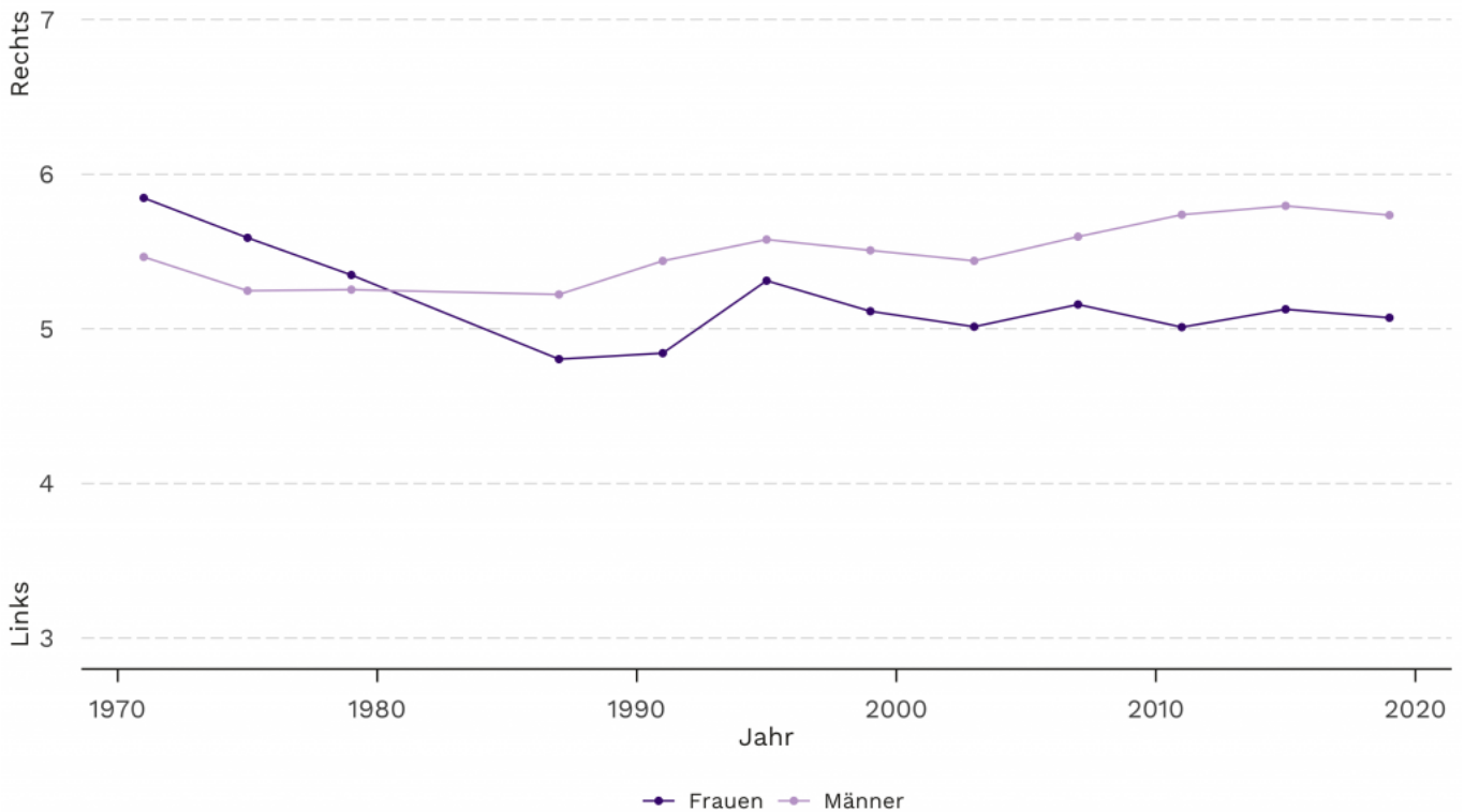
Abbildung 3: Unterschiede auf der links-rechts-Achse zwischen Männern und Frauen

Somit lässt sich festhalten, dass ältere Schweizerinnen nach wie vor weniger an den Wahlen teilnehmen als gleichaltrige Männer. Bei der Einführung des Frauenstimmrechts hatten die Stimmen der Frauen kaum einen Einfluss auf die bestehenden politischen Kräfteverhältnisse. Doch im Laufe der Zeit haben die Frauen zu einer Stärkung der Linken beigetragen. Man darf gespannt sein, ob sich der Schweizer Geschlechtergraben bezüglich Beteiligung in naher Zukunft schliesst und wie sich die politischen Einstellungen von Männern und Frauen weiterentwickeln.