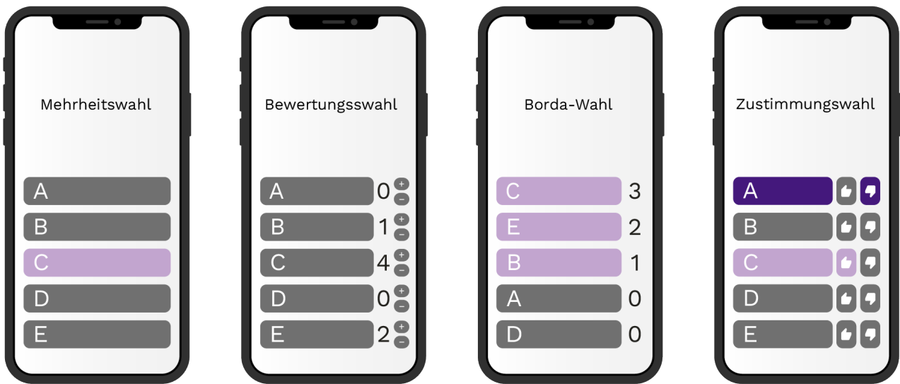
Abbildung: Alix d'Agostino, DeFacto