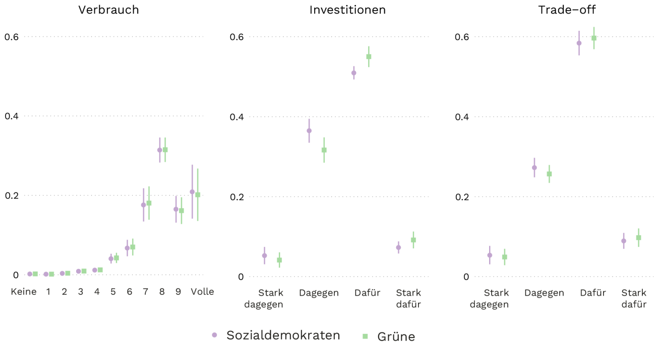
Abbildung: Alix d'Agostino, DeFacto · Datenquelle: Bremer und Schwander (2022) & European Social Survey (2016)

Wir sehen, dass grüne Wähler:innen soziale Investitionen tatsächlich etwas stärker unterstützen als sozialdemokratische Wähler:innen (siehe mittleres Feld), aber ihre Unterstützung für den für den sozialkonsumptiven Wohlfahrtsstaat ist nicht signifikant geringer als bei sozialdemokratischen Wähler:innen. Die rechte Seite von Abbildung 2 zeigt, ob die Befragten eher in die Ausbildung von Arbeitslosen investieren oder deren Einkommensverluste ausgleichen würden. Dabei zeigt sich, dass grüne Wähler:innen soziale Investitionen nicht weniger unterstützen als sozialdemokratische Wähler:innen. Insgesamt deuten die Ergebnisse darauf hin, dass grüne Wähler:innen einen investitionsorientierten Wohlfahrtsstaat unterstützen, aber nicht auf Kosten des sozialkonsumptiven Wohlfahrtsstaat.